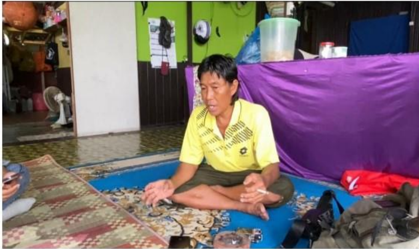
Gambar 2. Pelaksanaan wawancara bersama pemilik Budidaya Cacing ANC