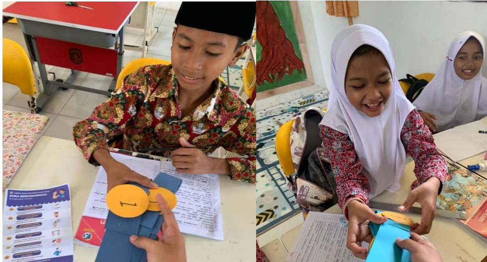
Gambar 3. Pembagian Nomor Kepada Peserta