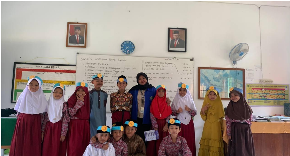
Gambar 4. Peserta Penggunaan Model NHT

Observasi: Siswa yang awalnya terlihat kurang tertarik dan seringkali teralihkannya, menjadi lebih fokus dan bersemangat setelah adanya pembagian nomor dan tugas presentasi. Dengan begitu, pembelajaran menjadi lebih interaktif dan tidak hanya bergantung pada penyampaian materi dari guru saja.