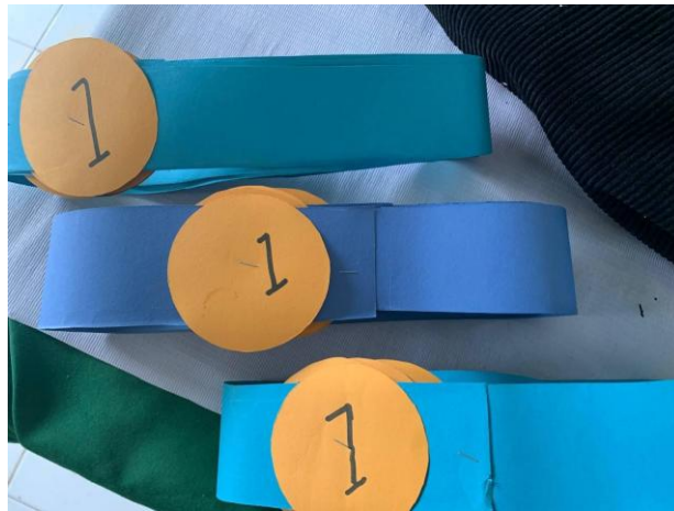
Gambar 2. Alat Peraga Model NHT

Observasi: Di akhir sesi, sebagian besar siswa yang sebelumnya cenderung pendiam terlihat lebih nyaman dan percaya diri dalam berbicara di depan teman-temannya. Mereka mulai terbiasa untuk berbicara dan mempresentasikan ide mereka, baik secara lisan maupun dalam bentuk tulisan. Peningkatan kepercayaan diri ini sesuai dengan temuan penelitian yang menunjukkan bahwa tugas berbicara di depan kelas, terutama dalam konteks pembelajaran kooperatif, dapat meningkatkan rasa percaya diri siswa (Sakban & Wahyudin, 2020).